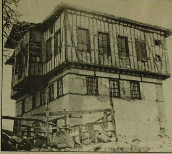
Bir zamanlar tanınmış iş adamlarımızdan Vehbi Koç'un otordduğu şimdi ise kiraya verilen Ankara'da Keçiören'deki bağ evi.