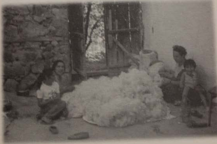
Resim 2: Gelin kızın çeyizine girecek yatak için yün didimi.