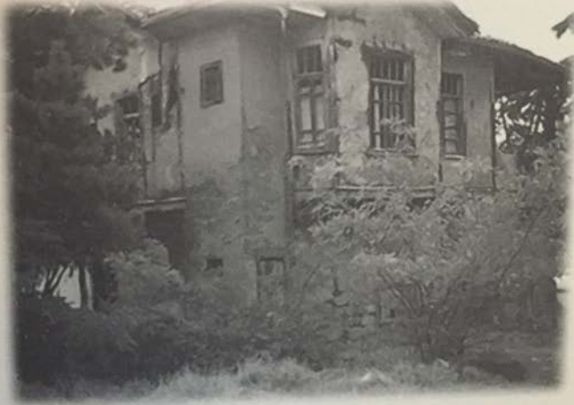
Resim 2: Keçiören'de onarıma muhtaç bir bağ evi.