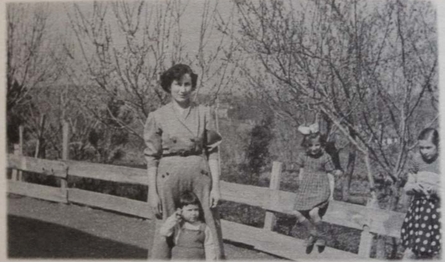
Resim 2: 1950'li yılların başında Ankara bağ evlerinde hayat. (Meral Bostancı albümünden)

Fotoğraflar: Toygar, K., & Toygar, N. B. (2005). Ankara'da bağcılık ve bağ kültürü. Ankara: Birlik Matbaacılık.