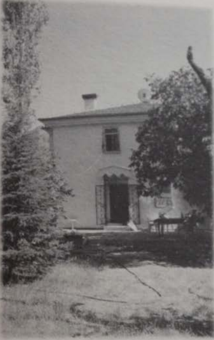
Resim 5: Karadere bağlarında yeni bir bağ evi.(2000)