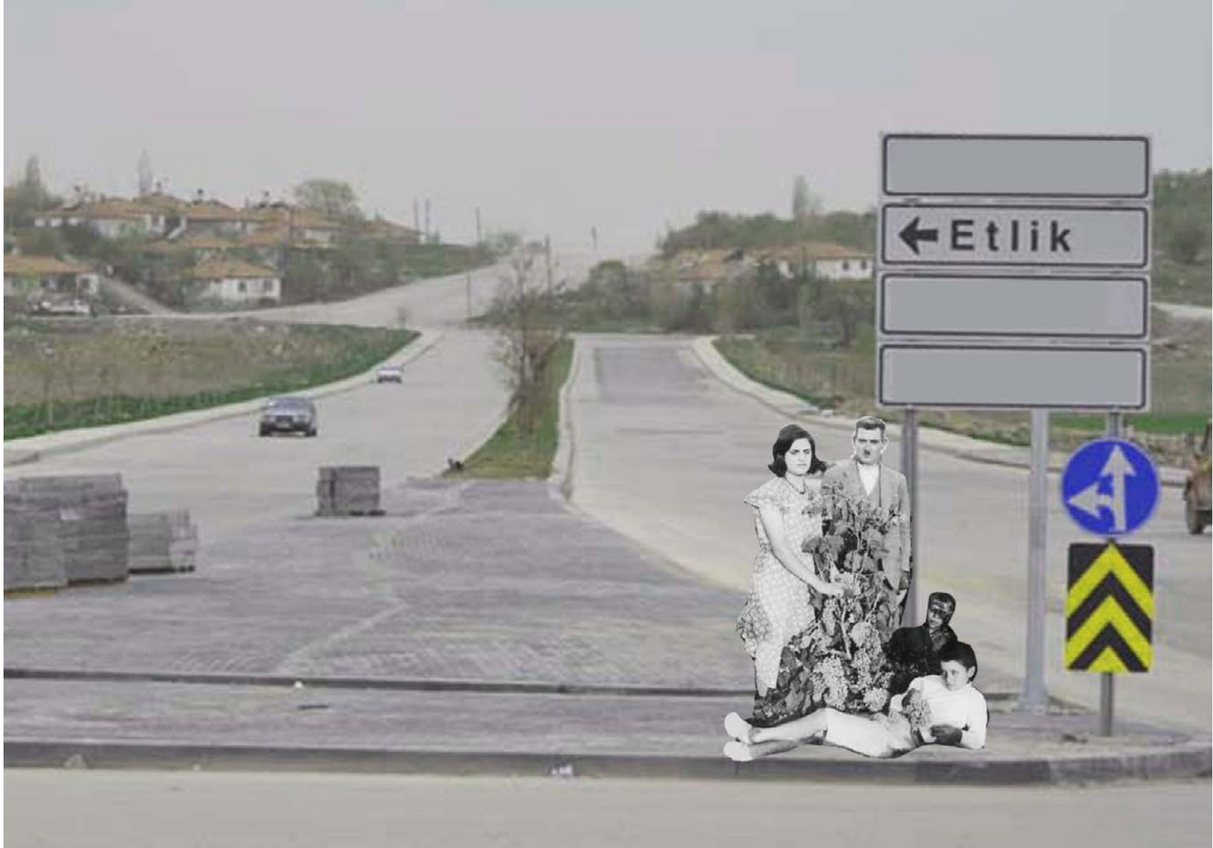
Ankaradaki baęlar: Etlik baęları, Keçiören baęları, Kalaba baęları, Karacakaya baęları, Balceriz baęları, Samanlık baęları, Frenküzü baęları, Seyran baęları, Esat baęları, Kavaklıdere baęları, Çankaya baęları, Ayrancı baęları, Dikmen baęları, Öveç baęları, Balgat baęları, Çaltaklı baęları