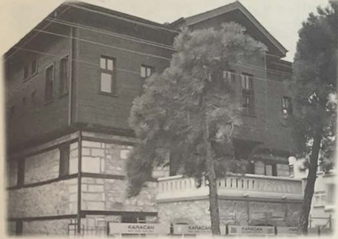
Resim 1: Keçiören'de onarılan bir bağ evi.