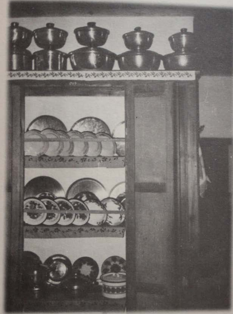
Resim 5: Bağ evinde mutfak.