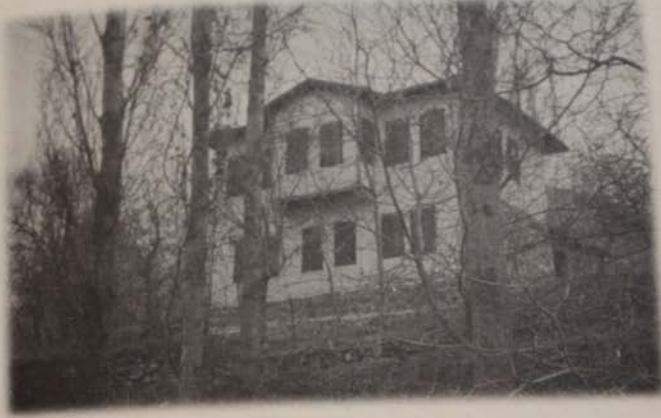
Resim 1: Karadere Bağlarında Metin TEKGÜNDÜZ bağ evi.